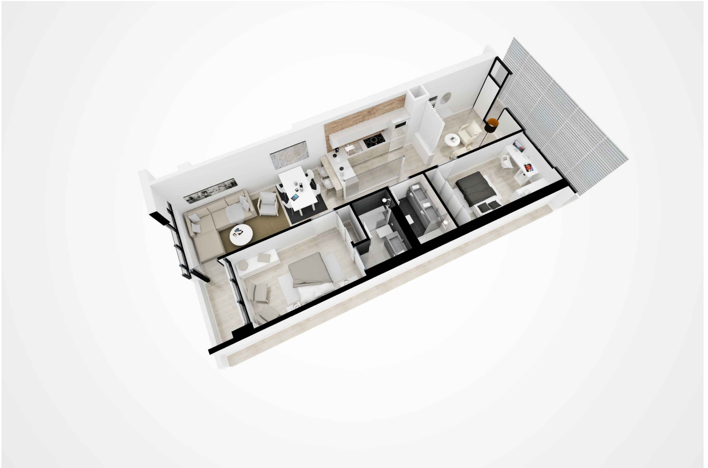
Vista aérea de distribución de la vivienda completa.