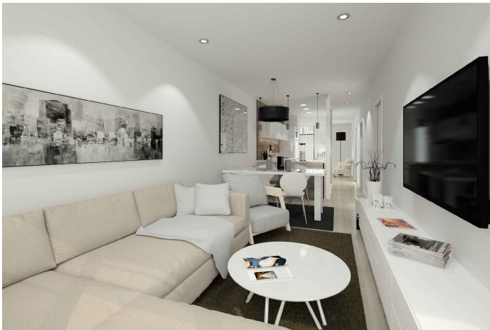
Vistas interiores salón-comedor-cocina.