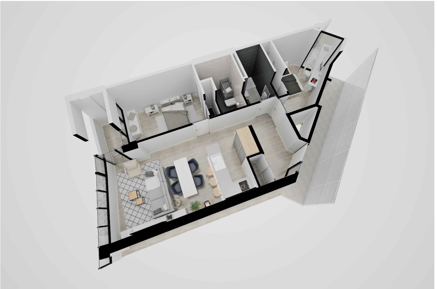
Vista aérea de distribución de la vivienda completa.