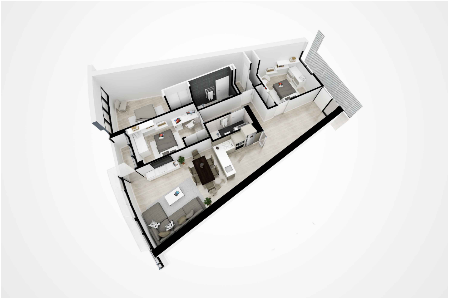
Vista aérea de distribución de la vivienda completa.